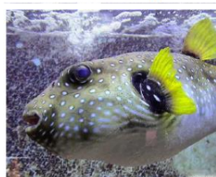
Un poisson ballon