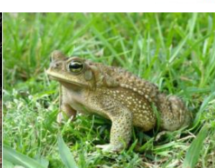
Un crapaud commun