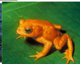
Un crapaud doré